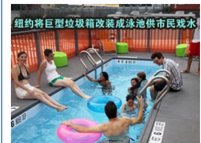
纽约将巨型垃圾箱改装成泳池供市民戏水