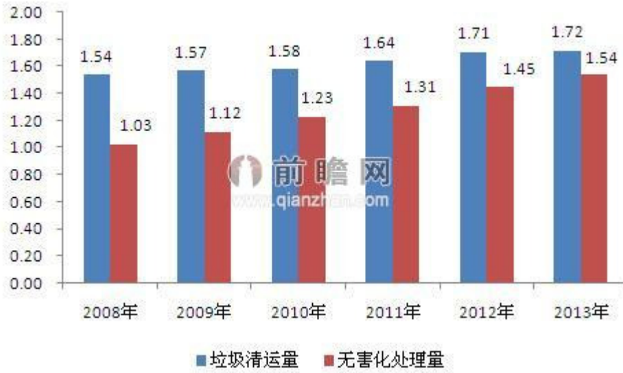
图表 2：2008-2013 年全国城市生活垃圾清运量和无害化处理量(单位：亿吨)