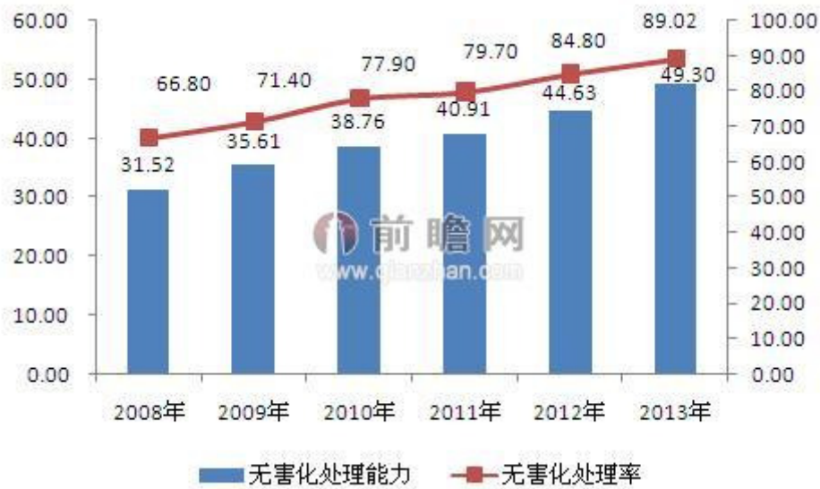
图表 3：2008-2013 年城市生活垃圾无害化处理能力和无害化处理率(单位：万吨，%)