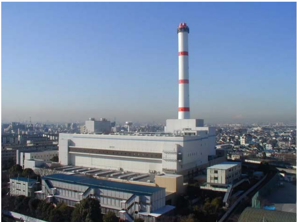
（日本东京足立生活垃圾焚烧厂）

日本东京足立项目简介：炉排炉、规模 350t/dx2 台，交付时间 2005 年。该项目建设在市中心，周围毗邻学校和居民区，在烟气排放指标控制上有着严格的要求,是东京的环保教育基地，有着良好的居民互动。