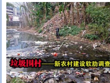
垃圾围村——新农村建设软肋调查