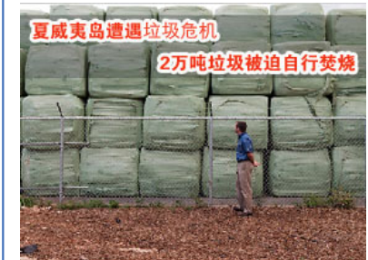
夏威夷岛遭遇垃圾危机 2万吨垃圾被迫自行焚烧