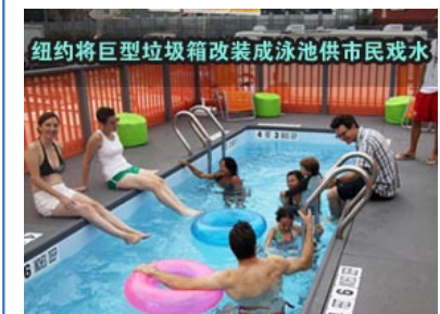
纽约将巨型垃圾箱改装成泳池供市民戏水