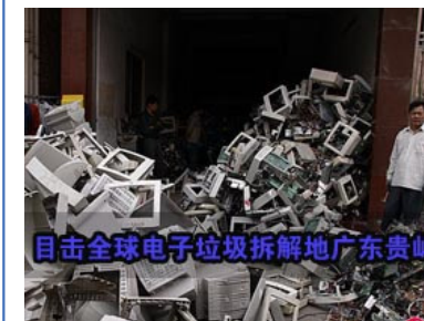
目击全球电子垃圾拆解地广东贵屿