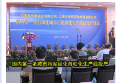
国内第一条城市污泥固化自动化生产线投产