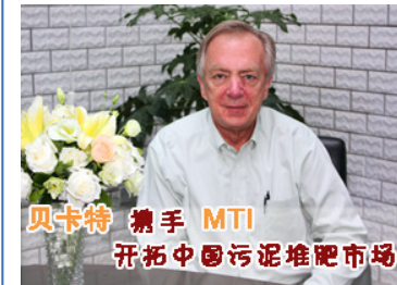
贝卡特携手 MTI 开拓中国污泥堆肥市场