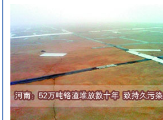
河南: 52万吨铬渣堆放数十年致持久污染