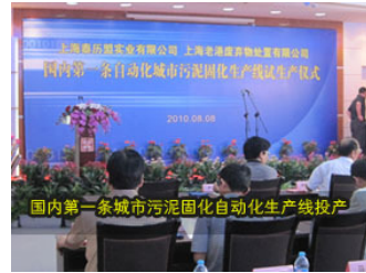
国内第一条城市污泥固化自动化生产线投产