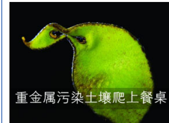
重金属污染土壤爬上餐桌