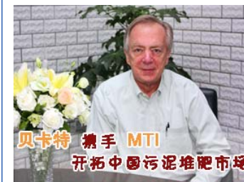
贝卡特携手MTI 开拓中国污泥堆肥市场