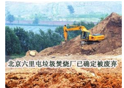
北京六里屯垃圾焚烧厂已确定被废弃