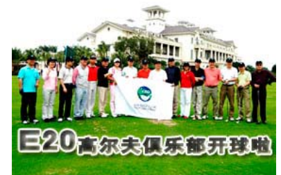
E20高尔夫俱乐部开球啦