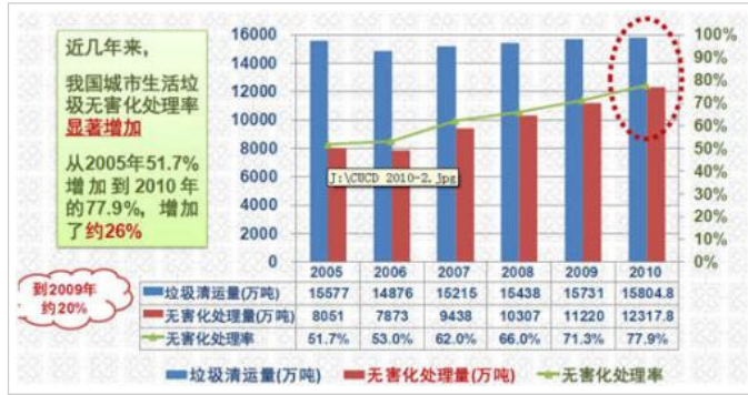
附3: 我国城市生活垃圾无害化处理率变化图