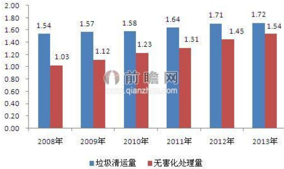
圖表 2：2008-2013 年全國城市生活垃圾清運量和無害化處理量(單位：億噸)