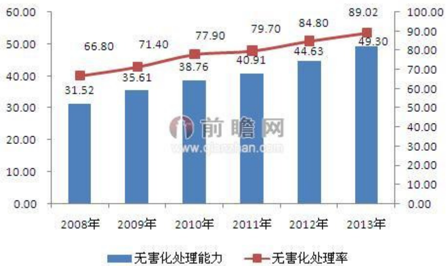
圖表 3：2008-2013 年城市生活垃圾無害化處理能力和無害化處理率(單位：萬噸，%)